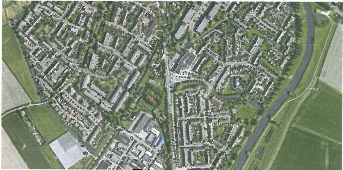
Figuur 1. Locatie